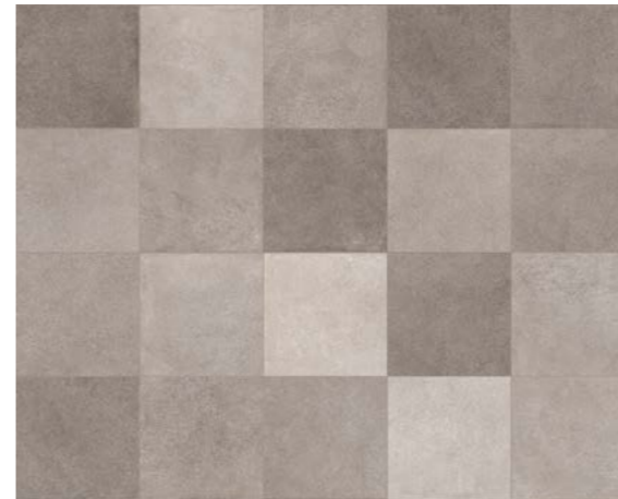
MIX GRIGIO 30,2x30,2 - 12"x12"

■ Naturale/Rettificato Matte/Rectified Matt/Rektifiziert Matt/Rectifié