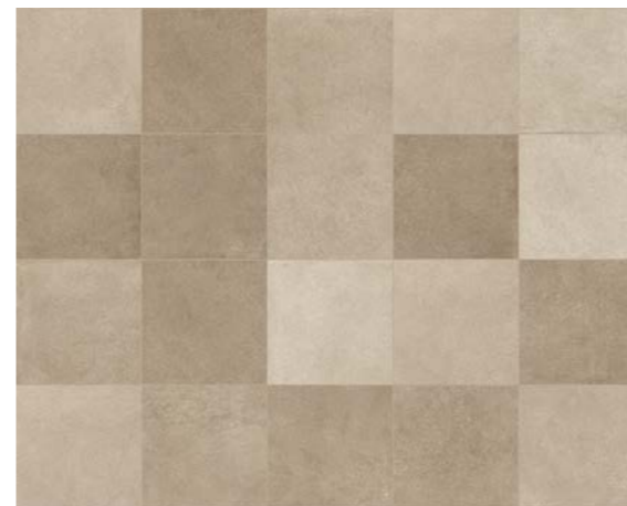
MIX TERRA 30,2x30,2 - 12"x12"

* Da utilizzare esclusivamente a rivestimento To be used only on walls. Nur zur Verkleidung verwendbare. Exclusivement destinés à un revêtement mural.