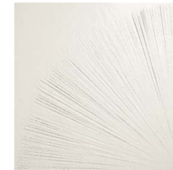
DECO VENTAGLIO 90,6x90,6 - 36"x36"