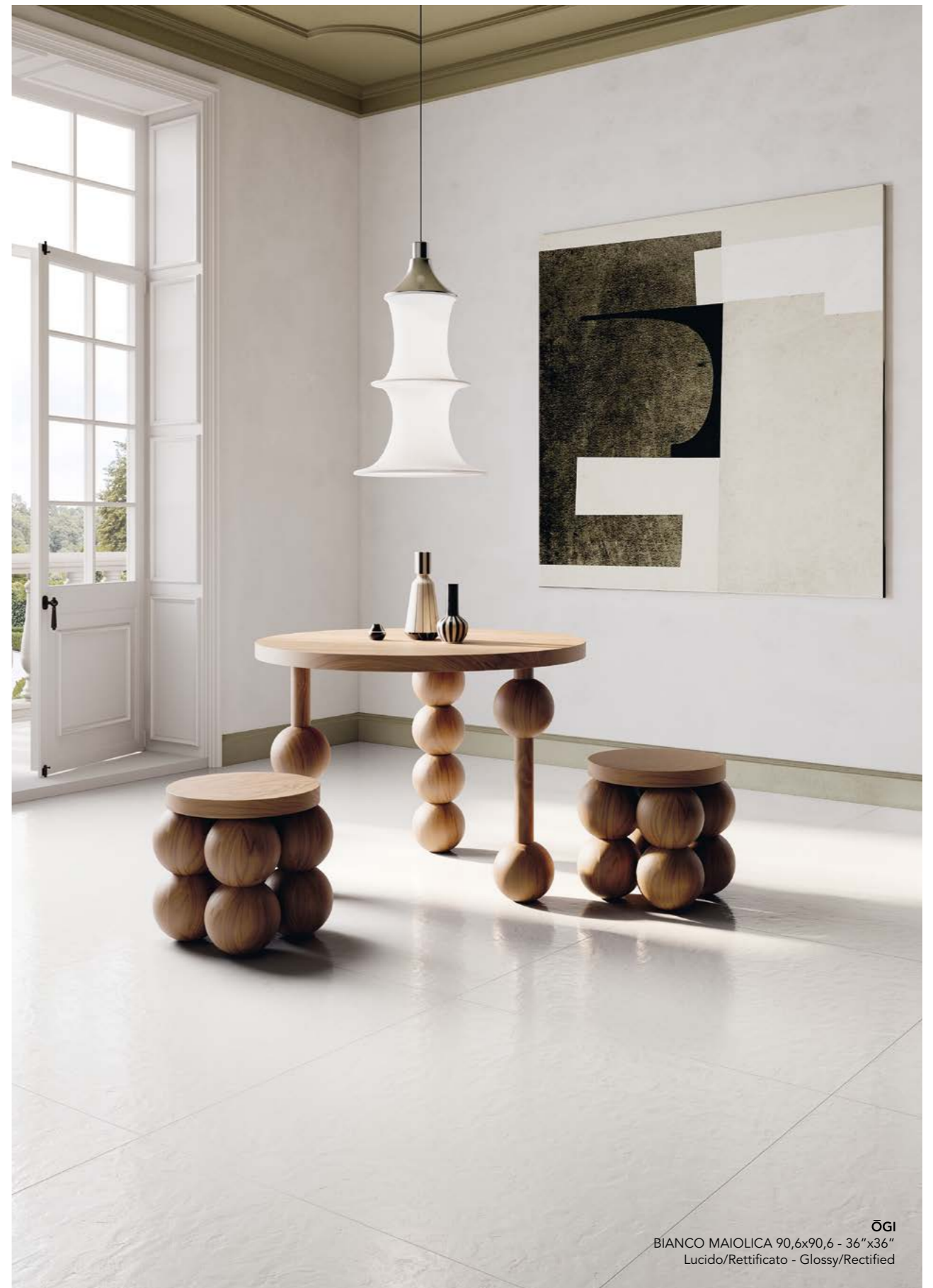
OGI BIANCO MAIOLICA 90,6x90,6 - 36"x36" Lucido/Rettificato - Glossy/Rectified