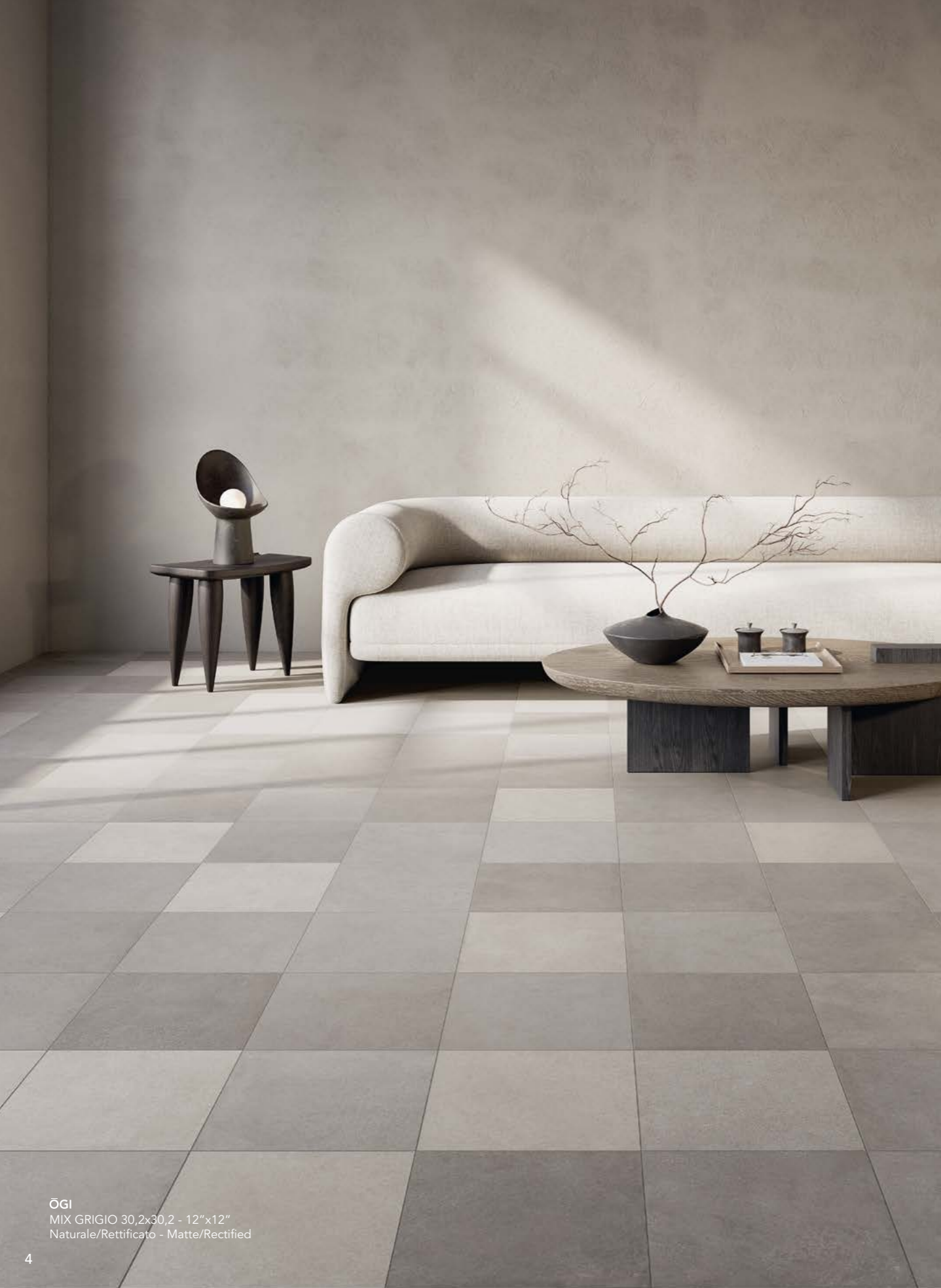
OGI MIX GRIGIO 30,2x30,2 - 12"x12" Naturale/Rettificato - Matte/Rectified