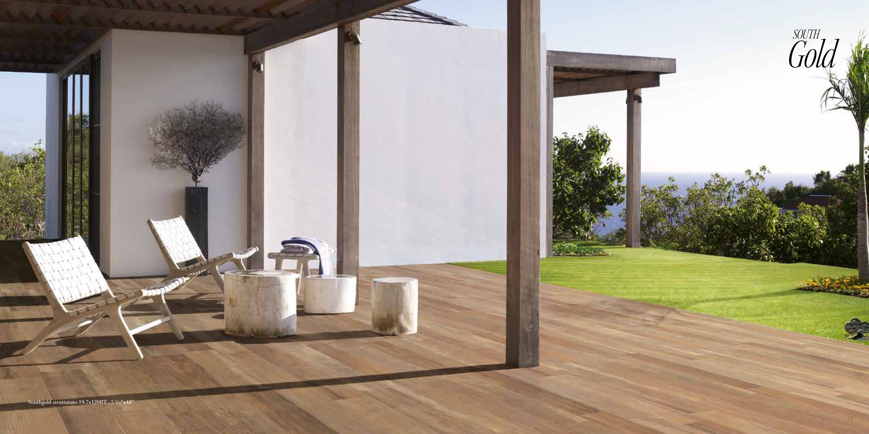
Southgold strutturato 19.7x120RT - 7 3/4"x48"