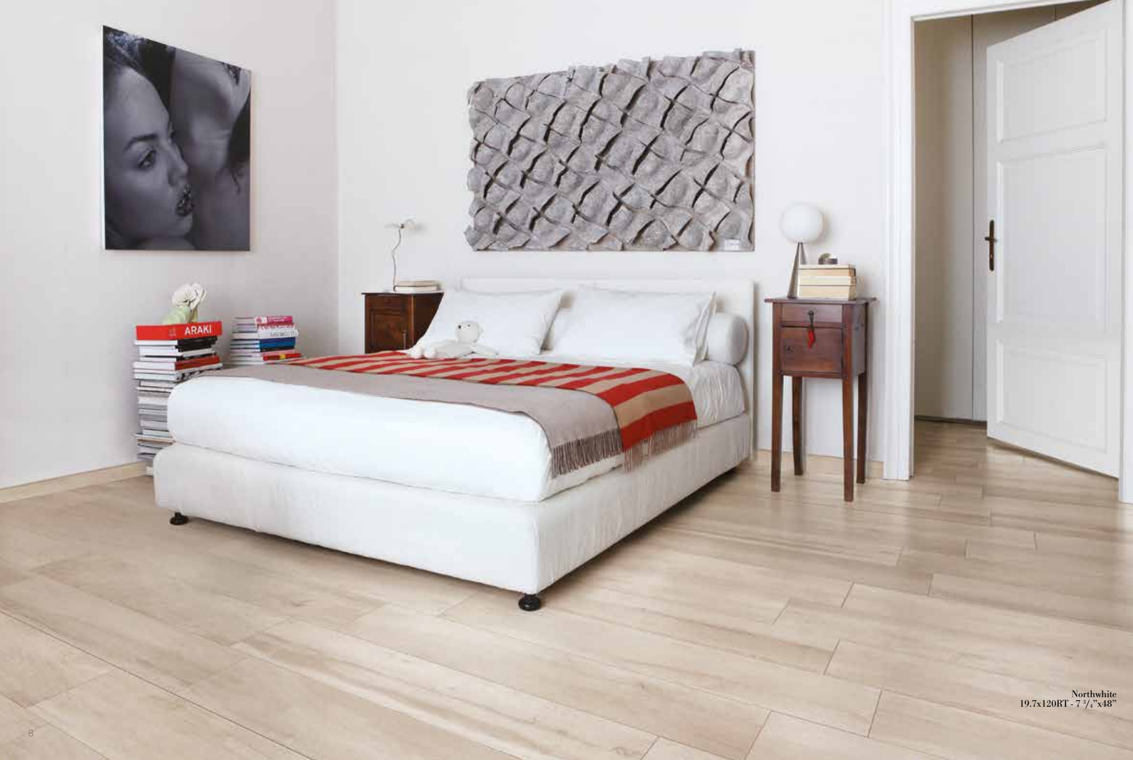
Northwhite 19.7x120RT - 7 3/4" x 48"